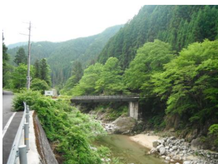
写真3 No.2 地点 上村川上流 明林橋