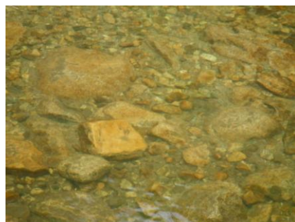
写真 30 No.30 地点 段戸川流 同左 (河床、アマゴ稚魚の群れ)