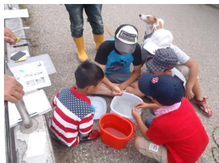
写真21 No.7地点 矢作川中流 同上 (測定)