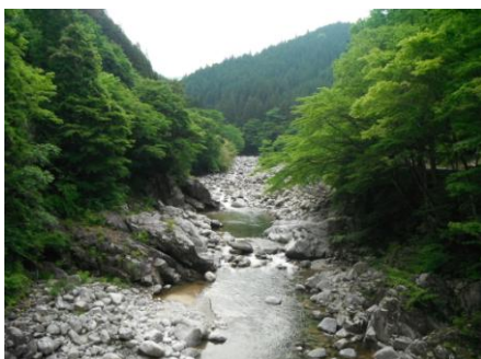
写真5 No.2 地点 上村川上流 同上 (上流側)