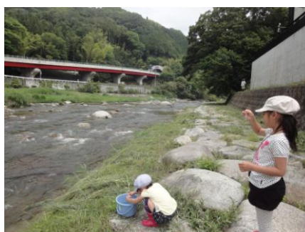
写真 32 No.9'地点 巴川中流 同左下流側 (足助川・巴川合流後)