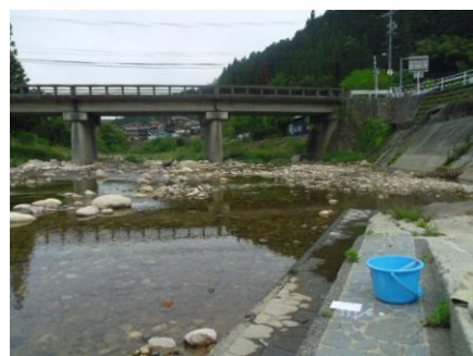
写真15 No.5 地点 根羽川上流・小戸名川 平瀬橋