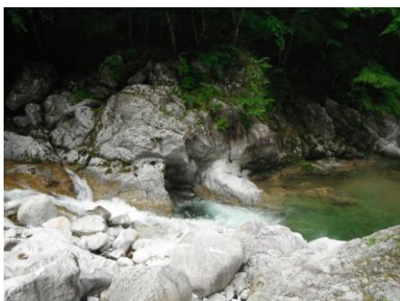
写真7 No.3 地点 上村川上流 ひつが沢の甌穴