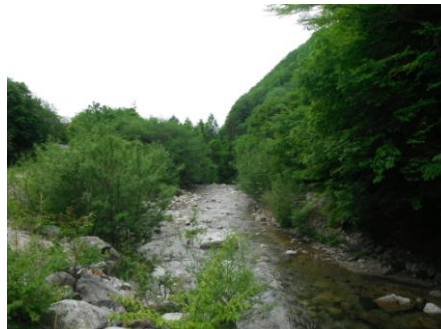
写真2 No.1 地点 柳川 同左 下流側