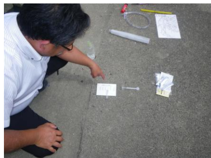
写真 26 No.8' 地点 矢作川下流 同左 (測定)