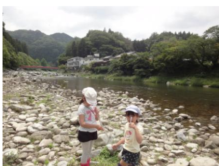
写真 31 No.9 地点 巴川中流 巴橋