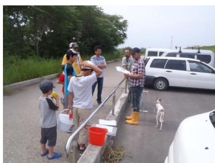
写真19 No.7地点 矢作川中流 日名橋 (集合説明)