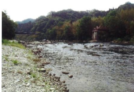
写真17 No.6地点 矢作川上流 旧富国橋 (撤去、右岸側から)