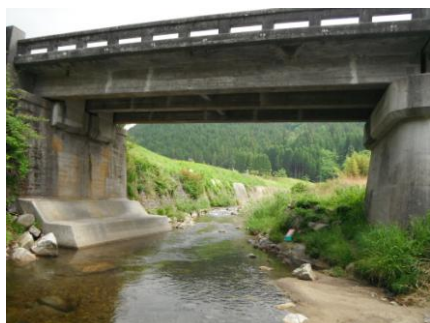
写真 29 写真No.30 地点 段戸川上流 大橋