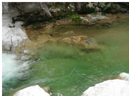
写真8 No.3 地点 上村川上流 同左