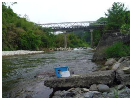
写真9 No.3 地点 上村川下流 鶴鴿 (せきれい) 橋