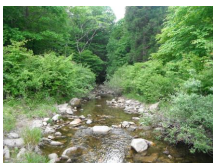
写真 27 No.42 地点 段戸川上流 段戸裏谷原生林の沢 (出口)