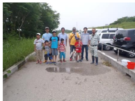
写真22 No.7地点 矢作川中流 同左 (調査終了)