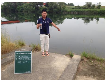
写真18 No.34地点 矢作川中流 竜宮橋