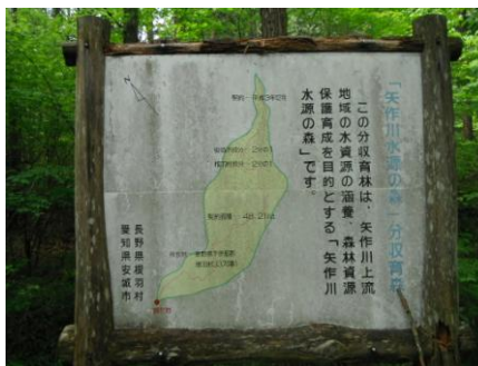
写真12 No.30 地点 根羽川上流・小戸名川 同左 (水源の森)