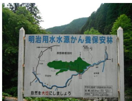
写真4 No.2 地点 上村川上流 同左 (明治用水水源かん養保安林)