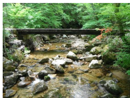
写真11 No.30 地点 根羽川上流・小戸名川 茶白山・矢作川水源の森の沢