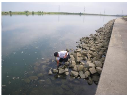
写真 25 No.8' 地点 矢作川下流 棚尾橋 (6/1)