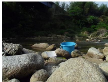
写真16 No.4 地点 根羽川下流 国界橋