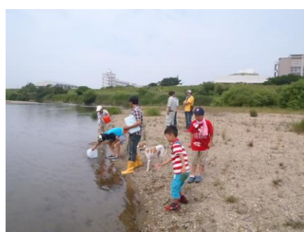
写真20 No.7地点 矢作川中流 同左 (採水・観察)