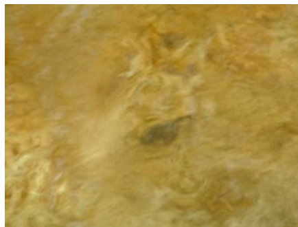
写真13 No.5 地点 根羽川上流・小戸名川 同上、アマゴが多く生息 (漁協管理)