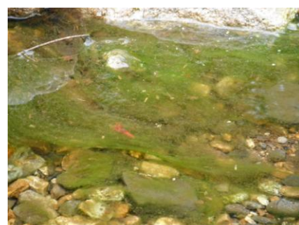
写真 28 No.42 地点 段戸川上流 同左、河床 (緑藻類)