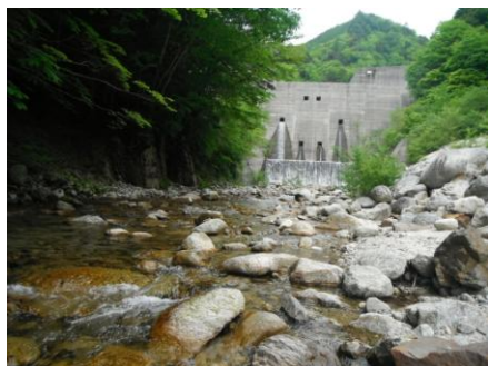
写真1 No.1 地点 柳川 矢作川源流の碑 上流側