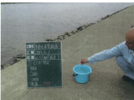
写真24 No.8地点 矢作川下流 同左 (測定)