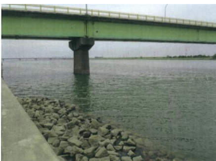
写真23 No.8地点 矢作川下流 棚尾橋 (5/31)