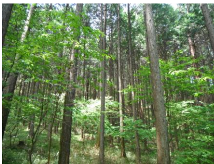
写真14 No.30 地点 根羽川上流・小戸名川 同上 (集水域の分収育林)